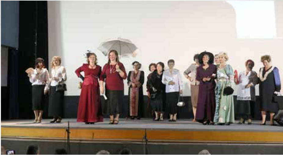
Από την εμφάνιση του χορευτικού τμήματος του Κέντρου Ιστορικής και Λαογραφικής Έρευνας «Ο ΑΠΟΛΛΩΝ» Καρδίτσας στις ετήσιες εκδηλώσεις «ΜΕΡΕΣ ΠΑΡΑΔΟΣΗΣ 2018» που παρουσίασε αστικούς χορούς και τραγούδια της Σμύρνης και των παραλίων της Μ. Ασίας.