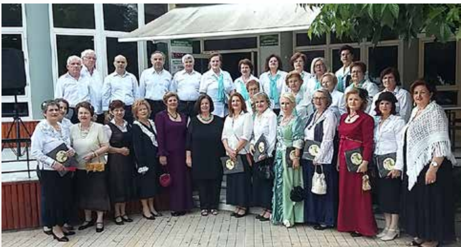
Από την εμφάνιση της Χορωδίας Παραδοσιακής Μουσικής του Κέντρου Ιστορικής και Λαογραφικής Έρευνας «Ο ΑΠΟΛΛΩΝ» Καρδίτσας στα Καραϊσκάκεια 2018 που παρουσίασε τραγούδια της Σμύρνης.

*Στο εξώφυλλο εικονίζεται η καρδιτσιώτικη ορχήστρα του Γιώργου Χατζηευθυμίου, το 1920 περίπου.